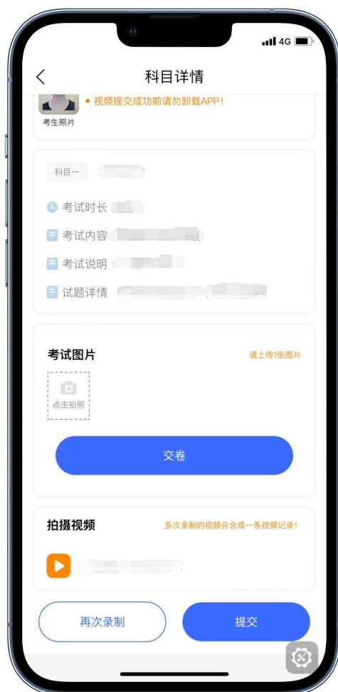
试卷照片及视频提交

录制视频结束后，考生须在考试规定的时间（“艺术升”APP平台录制的本专业科目一、科目二考试视频上传截止时间均为考试当天晚上 22:00。），点击并完成“正式考试”环节中手机 A 的“提交”操作，将手机 A 所录制的考试视频上传；考试时间结束后 72 小时内考生不得卸载“艺术升”APP。