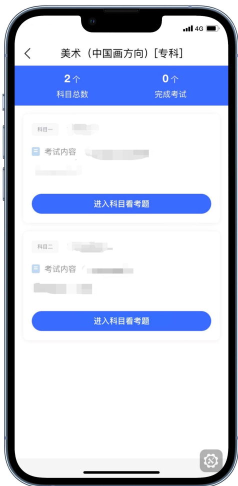
专业考试科目界面