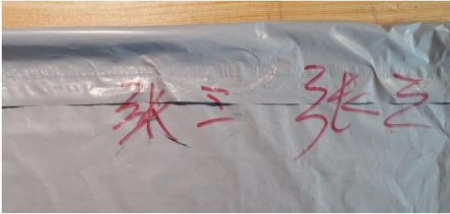
油性记号笔骑缝签名（颜色不限）